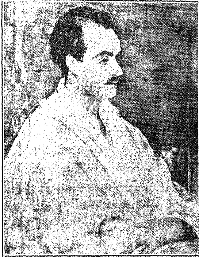
جبران خليل جبران عن صورة زيتية للمصور موريس فرمكيس