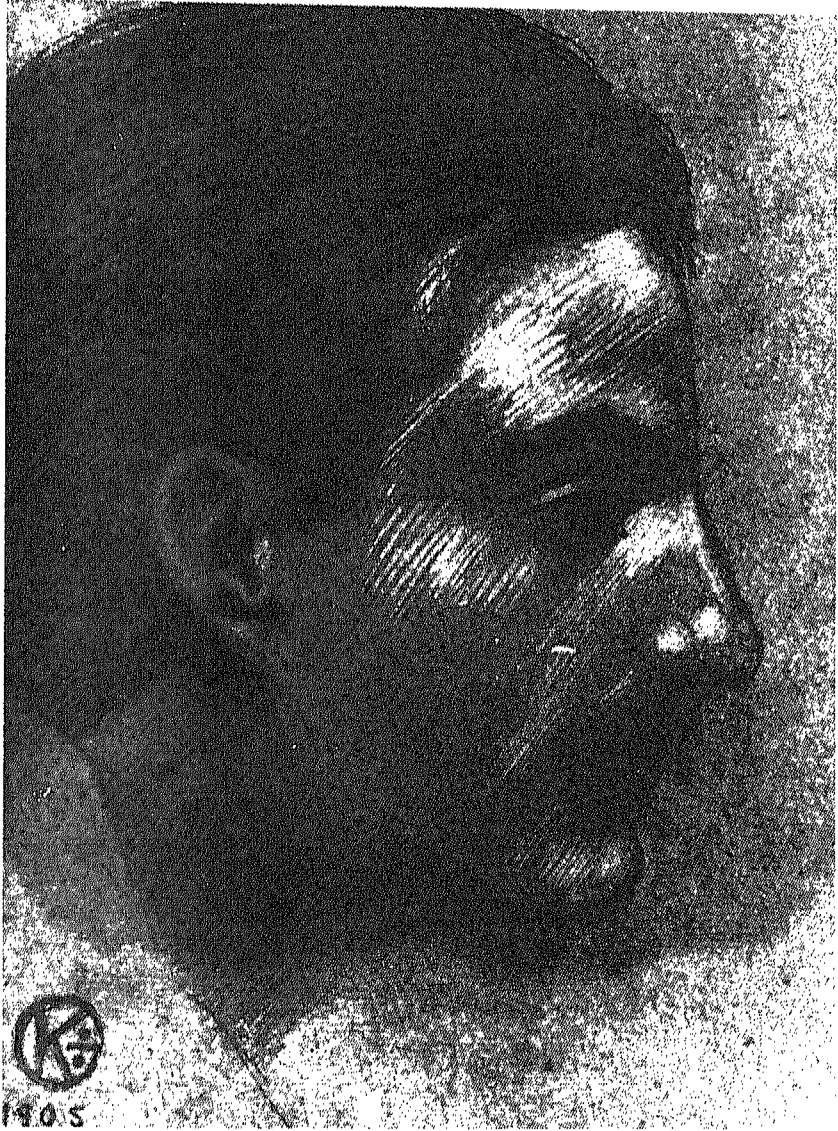
صورة الغلاف: وجه جبران بريشته - ١٩٠٥ م.