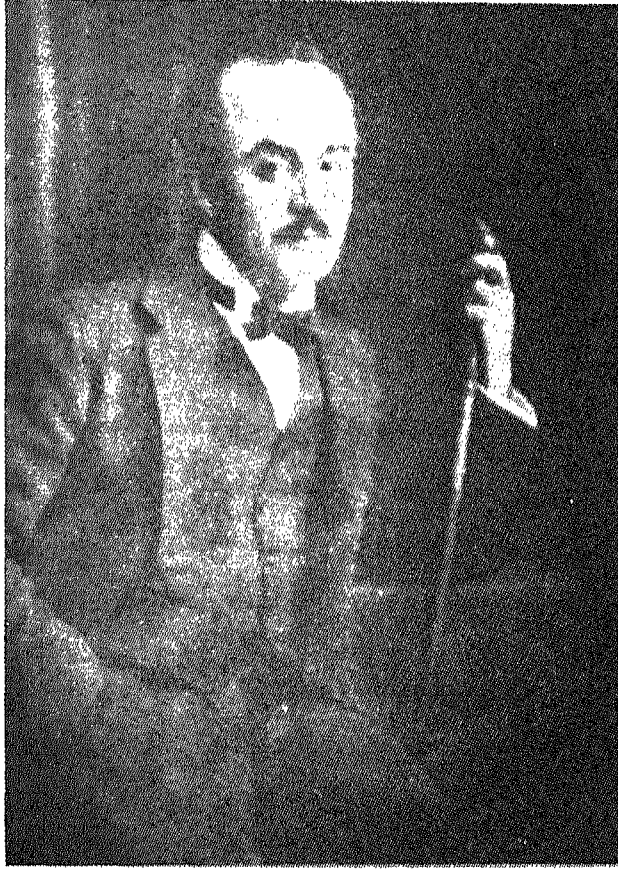
آخر رسم لجبران خليل جبران - صورة شمسية عمل ج. و. هوبي نيويورك نقلاً عن مجلة السائح ممتاز ١٩٢٣ .